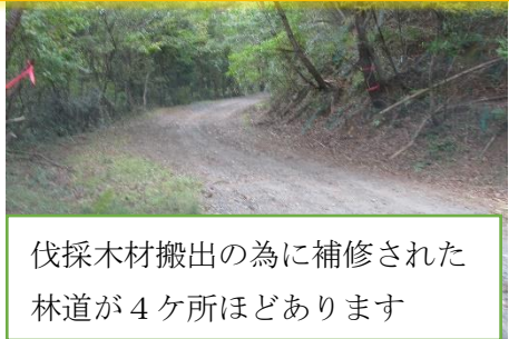
伐採木材搬出の為に補修された林道が4ヶ所ほどあります